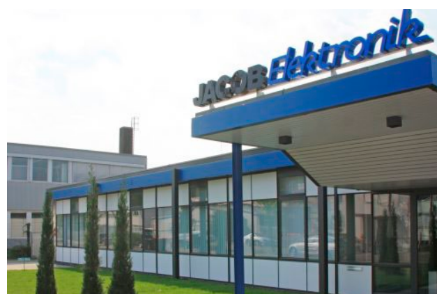
Jacob Elektronik Standort Karlsruhe