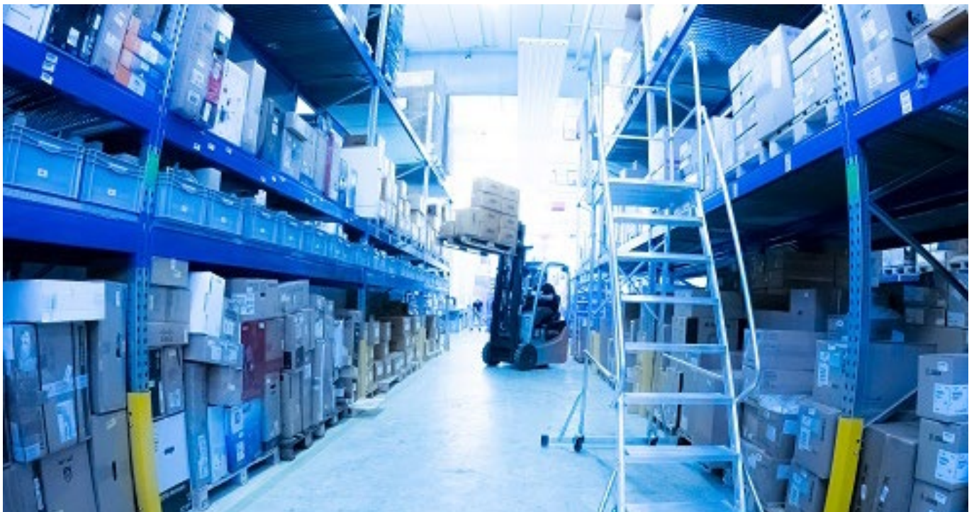
Jacob Elektronik Standort Karlsruhe

Die neue Infrastruktur ermöglichte es mit ihrer hohen Flexibilität und ihrer einfachen Administration, über 200 Mitarbeiter binnen weniger Wochen ins Homeoffice zu überführen – und dabei selbst die Nachfrageexplosion während des ersten Lockdowns erfolgreich zu bewältigen.