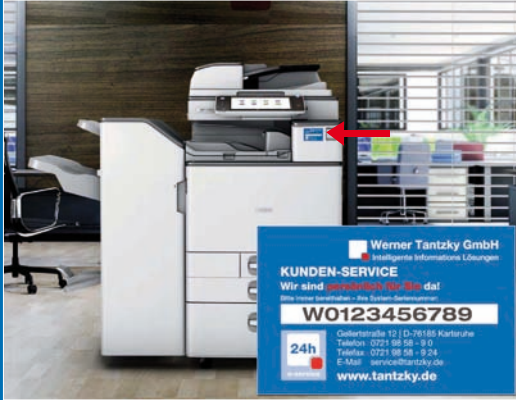
Abb. 1 – RICOH MP C3003 mit blauem Tantzky Aufkleber